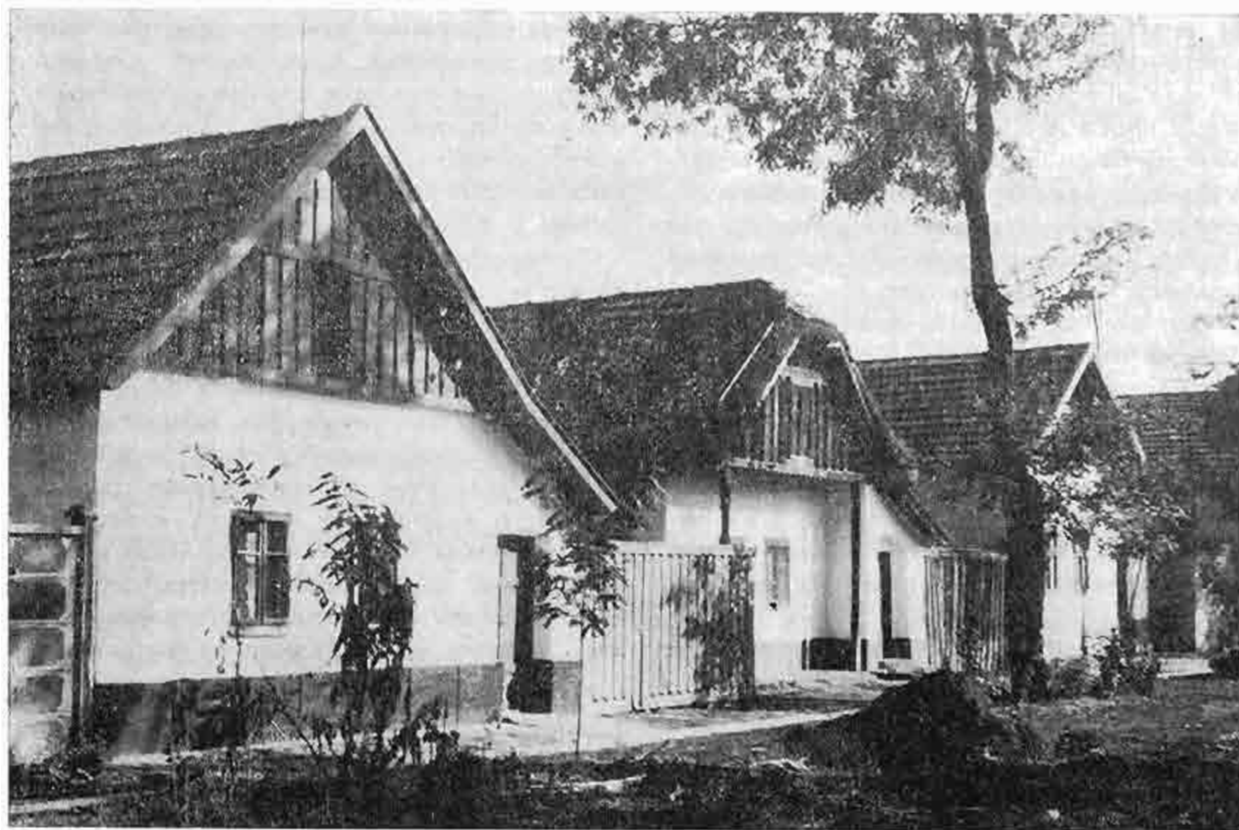
Rad domov s drevenými štítmi, Tótkomlós, Maďarsko. Foto J. Botík, 1973 Interiér ľudového domu v Tótkomlósi, Maďarsko. Foto J. Botík, 1973